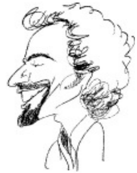
In Honduras von einem Straßenmaler für $ 1 gezeichnet!

Der in Fulda geborene sowie späterhin weitgereiste investigative Journalist schrieb erste Reportagen für die "Vancouver Sun" und den "San Francisco Chronicle", war Chefredakteur eines Hamburger Außenwirtschafts-Fachblatts u. betätigte sich als freier Mitarbeiter von "Spiegel", "Stern", "Neue Revue" sowie als Redakteur der ersten deutschen Verbraucherzeitschrift "DM".