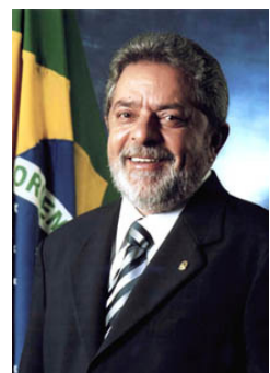
Lula Da Silva

Über die brasilianische Wirtschaft sollten Sie sich soviel merken: Die einst berüchtigten Schulden- u. Währungsprobleme gehören schon lange der Vergangenheit an. Heute gibt es einen grundsoliden "Real" und einen tollen Präsidenten, der zwar so rot ist wie Oskar Lafontaine, aber zum Segen aller tätig ist, inclusive der Staatskasse u. der Unternehmer. So hat "Lula" die IWF-Kredite vorzeitig zurückgezahlt, dabei fast eine Milli-arde Zinsen gespart und außerdem die Konjunktur so weit belebt, daß seit seiner Amtseinführung 2002/03 die Zahl der Arbeitsplätze um 4 Millionen anstieg.