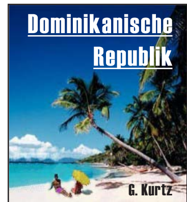
Infomappe € 70

Autor und Verlag erklären hiermit an Eidesstatt, daß der oben beschriebene große Kurtzsche Report über die Dominikanische Republik nicht auf virtuellen Begebenheiten, sondern von uns nachrecherchierten Fakten und Erlebnissen realer Personen basiert. So ließen wir uns von ausgewiesenen Amerikanern und deutschen Landsleuten berichten, wie sie in die DR kamen sowie dort geschäftlich u. persönlich reüssierten. Die Nachvollziehbarkeit dieser Fakten wurde uns von zahlreichen örtlichen Notabeln wie Anwälten, Bankern u. Ärzten bestätigt. Als Sahnehäubchen präsentieren wir im Report einen angesehenen Zeitzeugen in Text u. Bild, der in den Dreißigerjahren wg. seiner jüdischen Herkunft vor den deutschen Gaskammern floh, sechs Jahre lang durch halb Europa vagabundierte und schließlich in der DR sein sicheres Refugium samt Glück fand. Sogar mit seinem demnächst stattfindenden Hundertjährigen kann er dienen. Dieser Mann erklärt heute mit der ganzen Autorität seiner fast hundertjährigen Lebens- sowie 70jährigen DR-Landeserfahrung: "Ich glaube an die Zukunft der DR und kann mir nicht vorstellen, woanders zu leben!" - Er wird Ihnen das auch gern persönlich bestätigen. Im Report steht, in welcher Bar er täglich Punkt 17 Uhr seine zwei Brandys einnimmt!