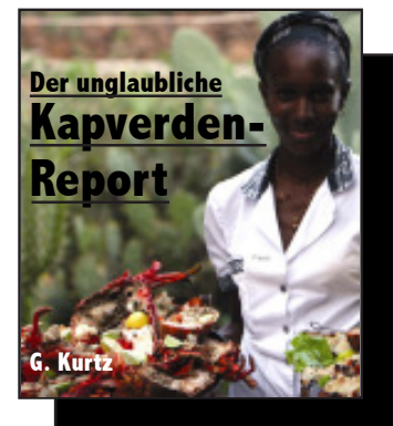
Infomappe € 70

Die journalistische Sternstunde dieses Verlags fand um das Jahr 1996 herum statt. Damals war es uns gelungen, vor dem Rest der Öffentlichkeit an vertrauliche Infos zu kommen, wonach eine frischgebackene, noch aus der portugiesischen Kolonial-Konkursmasse stammende südatlantische Inselrepublik (nur 1500 Kilometer weiter südlich von den Kanaren) ein brisantes Einbürgerungsrecht verabschieden würde.