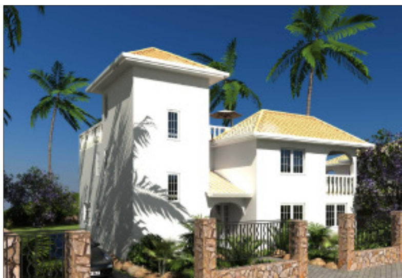
Villa auf Santiago Kapverden