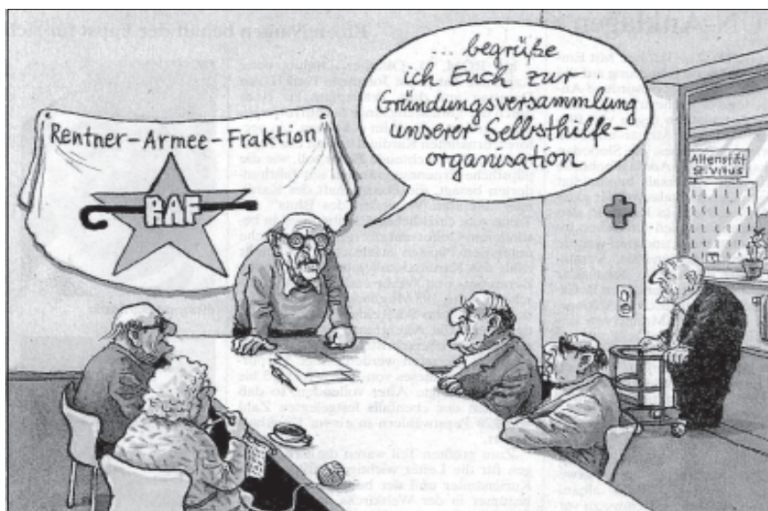
Der Widerstand wächst

machen, wie das bei Insulin u. Diabetes der Fall ist - nur eben zu Kosten von € 5000 pro Monat? Die Beitragsforderungen von BEK, DAK oder AOK dürften ins Unermessliche steigen. Auch die bewährte Flucht in Privatkassen können Sie vergessen, denn deren Einbeziehung in den großen Topf ("Nordkoreanisierung des deutschen Krankenversicherungswesens!") ist bereits fest eingeplant!