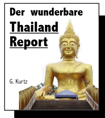
Infomappe € 70