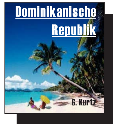
Infomappe € 70

9. Weil das Land groß und wichtig genug ist, daß sich dort eine Deutsch-Dominikanische Industrie u. Handelskammer befindet, die Sie bei Ihrem Aufstieg zum reichen Top-Unternehmer (siehe boomender Tourismus oder Herstellungsbetrieb in einer steuerfreien Produktionszone!) mit deutschsprachigem Rat u. Tat unterstützt.